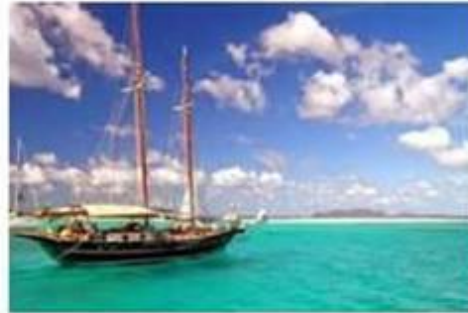
Les quatre saisons